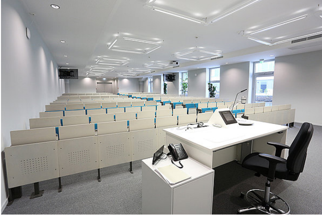
Raum: HH/H 1