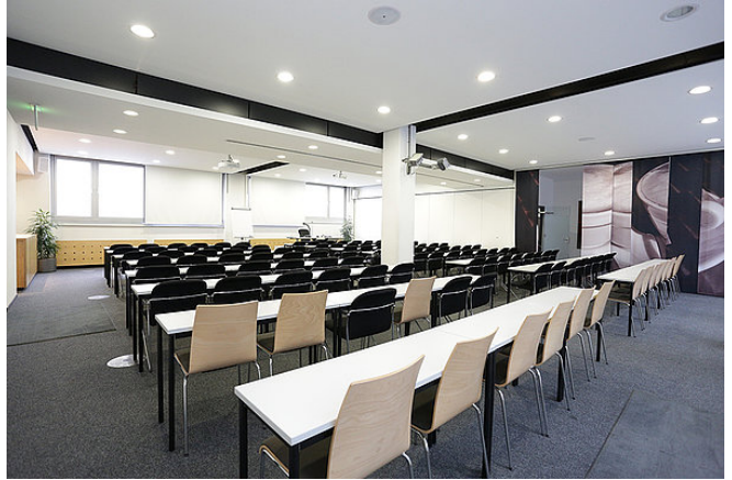
Raum: S/FOM-Konferenz 2