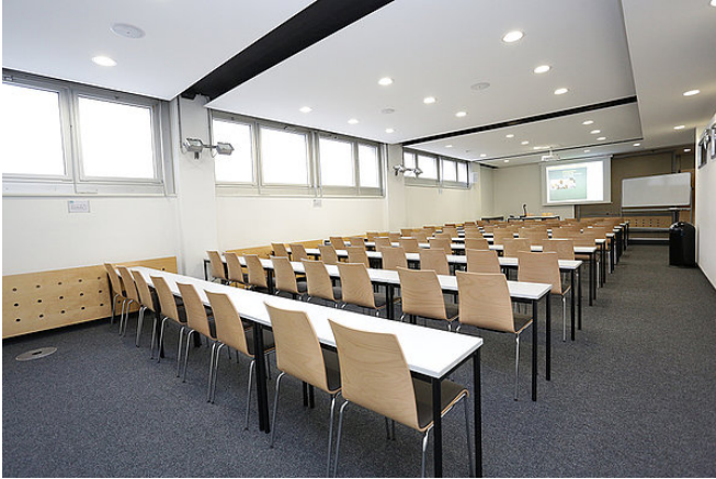
Raum: S/FOM-Konferenz 1